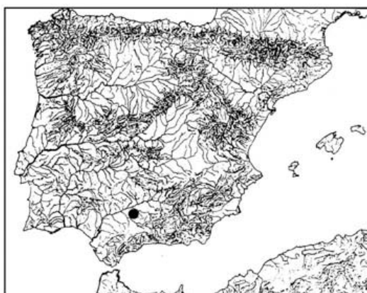
Fig. 1. — Situación de Porcuna en la Península ibérica.

La villa actual perpetúa hasta en su nombre a la antigua ciudad de Obulco , cognominada por los romanos Municipium Pontificiense , en virtud —creía Schulten— de una cierta primacía religiosa sobre los pueblos vecinos 4 . En las monedas numerosísimas que emitió, Obulco estampa, además de ese su nombre romano, otro equivalente al mismo, pero en alfabeto indígena: Ipolca , el autóctono, compuesto de ip- como los de Ipsca , Ip-onuba , Ip-tucci , y de oleca , que recuerda al étnico de los olcades , un pueblo de esta zona al que Aníbal sometió 4 bis . [-406→407-]