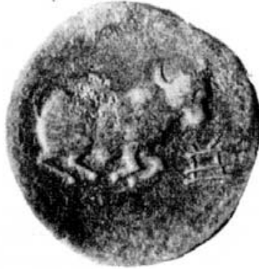
Figura 11. Moneda libio-fenicia de Ipora. Según M.P. García-Bellido.

repite en cecas héticas de Camo, Lastigi, Caura, etc., que representarían a Astarté-Tanit, diosa de carácter guerrero y de la fertilidad terrestre y marítima, como indican los atributos de estas monedas. En las cecas de estas ciudades de época ya romana, se colocó en los anversos una diosa galeada y en los reversos armas indígenas en Turirecina; al fruto terrestre en Carmo y al marítimo, sábalos en Caura, con creciente lunar, atributos de Tanit, En las emisiones de Lascuta se encuentra un Melkart helenizado y un elefante, animal típicamente africano. En lo que no seguimos a M.P. García-Bellido, es en relacionar a Ma Bellona, frecuente en Extremadura, con la diosa guerrera púnica.