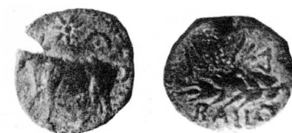
Figura 8. Moneda de Bailo. Según M.P. García-Bellido.