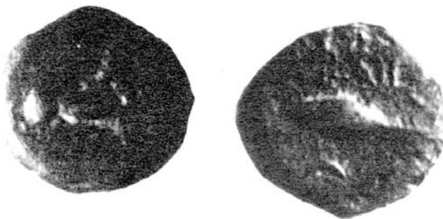
Figura 9. Moneda de Bailo. Según M.P. García-Bellido.

latino, con caballos en el anverso y atún con creciente en el reverso. En Bailo, al igual que en Asido, los símbolos monetales recordarían la diada máxima cartaginesa (Figs. 8-9). En monedas más recientes se coloca a Melkart, con lo que se tendría la triada máxima púnica. En los ases de Bailo (Fig. 10) Melkart va acompañado de una espiga, símbolo de Tanit. En Cartago se asocian frecuentemente estos dioses púnicos, En un as de Bailo se representó la triada púnica, pues figura un toro en el reverso. La espiga podría igualmente recordar el carácter agrario de