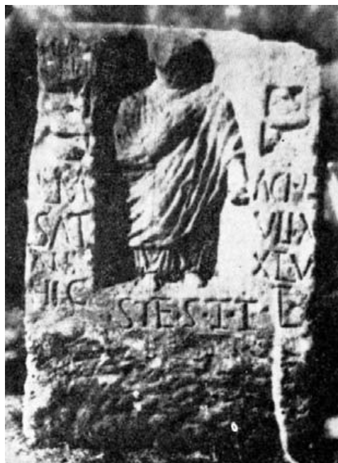
Fig. 3.- Castulo (Linares). Perdida.

Góngora, viaje Literario , ms. de la RAH, presentado en 1860 y editado en Jaén, s. a. (1915), núm. 31.— CIL II 3288.— Rivero, Lapidario del Museo Arqueológico Nacional , Valladolid, s. a., núm. 265.