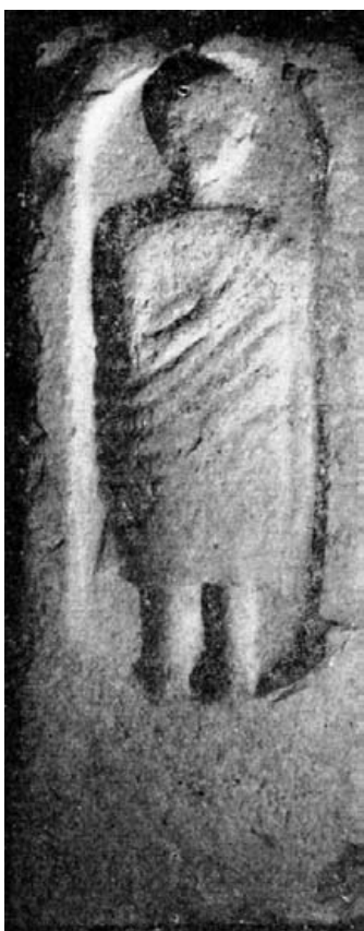
Fig. 1.- Cartagena. Museo de la localidad.

Hallada en 1925 a tres metros de profundidad al excavar los cimientos de la casa