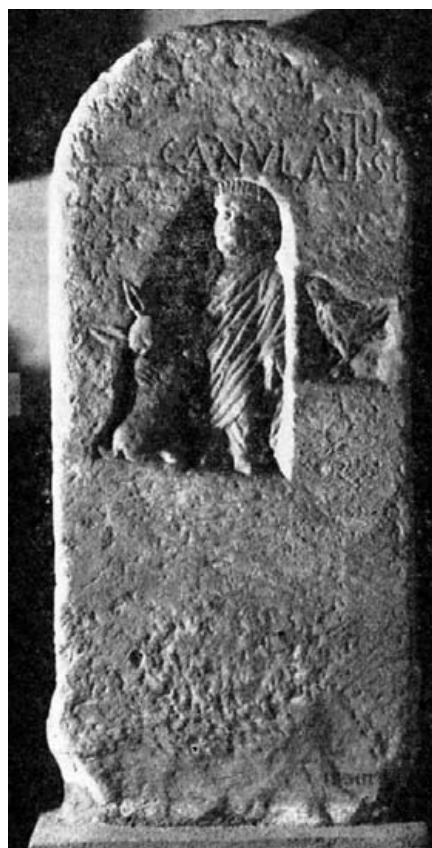
Fig. 2.- Castulo (Linares). Mus. Arq. de Madrid