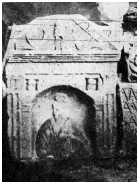
Fig. 4 B.- La estela de la figura anterior tal como la conoció Góngora.

Falta la parte superior, que cerraba en medio círculo, como las dos primeras y acaso también la tercera. De él queda claro el arranque en el lado izquierdo. El nicho, en cuarto de esfera, se ha conservado casi íntegro. Dentro de él se figura un personaje en pie, de frente, vestido con túnica corta y escotada en ángulo, muy similar en ello a la que